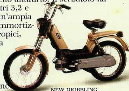
NEW DRIBBLING Monomarcia a pedali.

I modelli kick e variatore con sella lunga hanno in dotazione ruote in lega leggera.